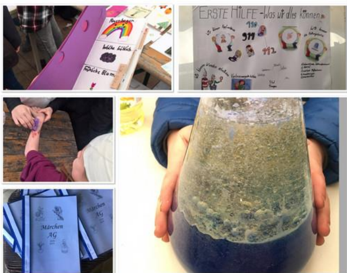
++ Buchbinder ++ Erste Hilfe ++ Experimente ++ Märchen

Eine besondere Leistung erbrachte unsere Neigungsgruppe „Schülerzeitung“ unter der Leitung von Frau Schwertfeger. Wie bereits angekündigt, nahm die Gruppe mit einer ihrer Ausgaben an einem landesweiten Wettbewerb teil- mit Erfolg! Die Zeitung wurde mit Silber ausgezeichnet und mit 300