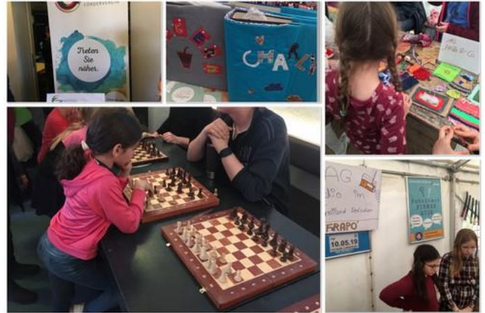
++ Schach ++ Wolle ++ Nähen ++ Radio